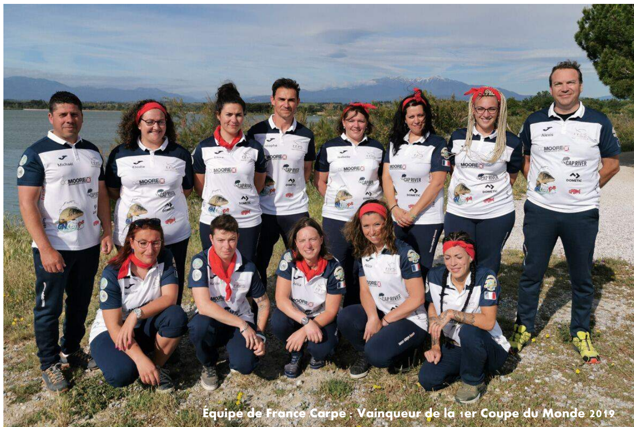
Équipe de France Carpe : Vainqueur de la 1er Coupe du Monde 2019