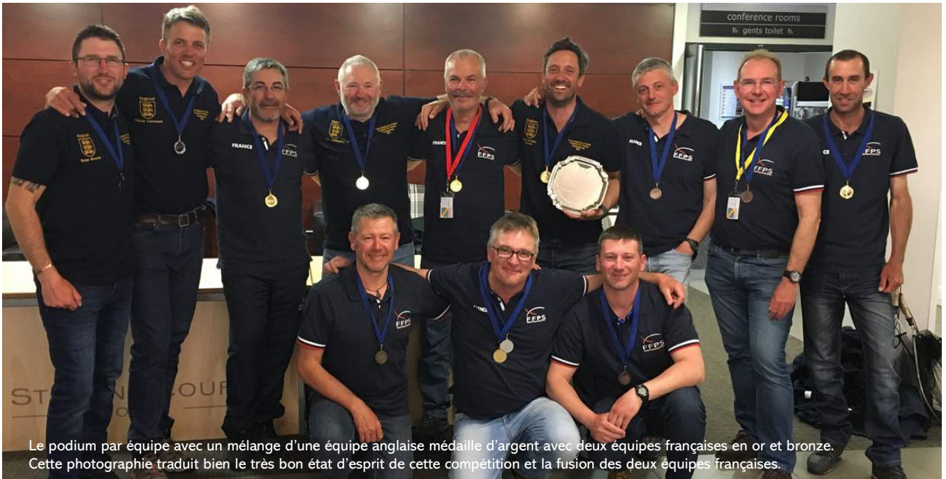
Le podium par équipe avec un mélange d'une équipe anglaise médaille d'argent avec deux équipes françaises en or et bronze. Cette photographie traduit bien le très bon état d'esprit de cette compétition et la fusion des deux équipes françaises.