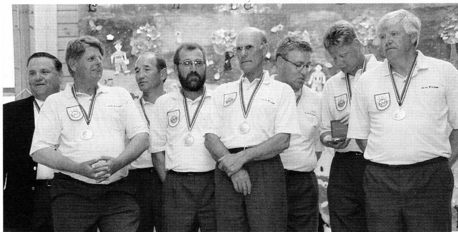
L'équipe gagnante : SILSTAR TEAM (Hollande)