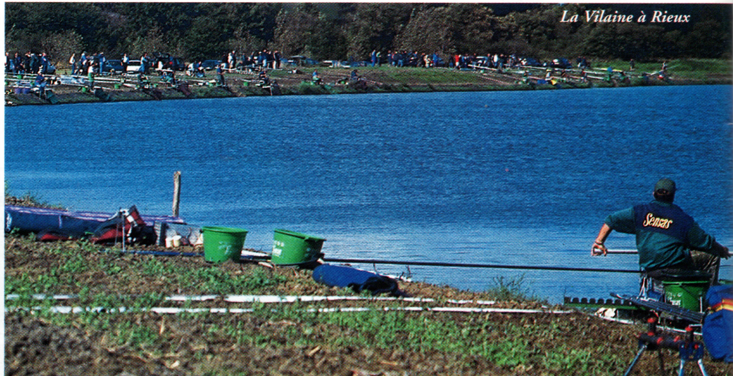
La Vilaine à Rieux